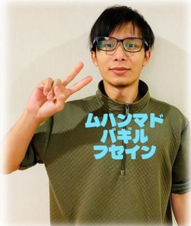
ムハンマド バキル フセイン