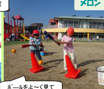
ホールをよ〜く見て