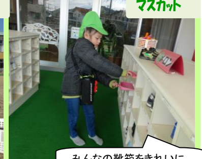
みんなの靴箱をきれいに