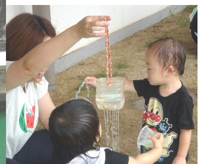
ペットボトルシャワー